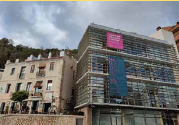
MUPAM - Museo del Patrimonio Municipal