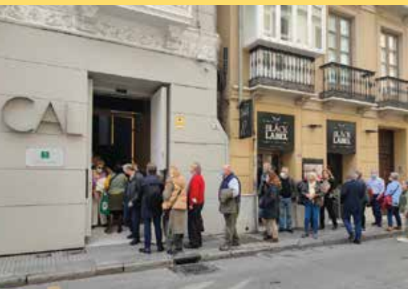
CAL Centro Andaluz de las Letras