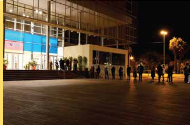
Auditorio Edgar Neville. Diputación de Málaga