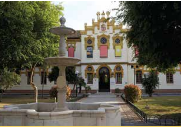
Centro Cultural La Térmica