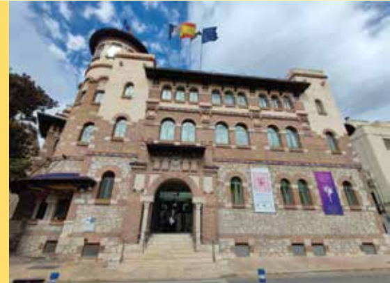
Rectorado Universidad de Málaga